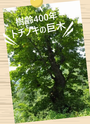
樹齢400年 トチノキの巨木