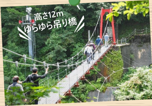
高さ12m ゆらゆら吊り橋