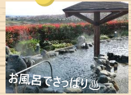
お風呂でさっぱり